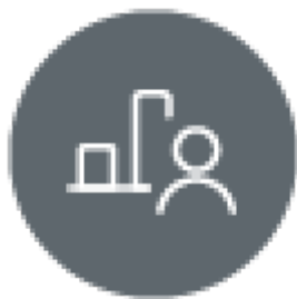
Tableau de bord des apprenants